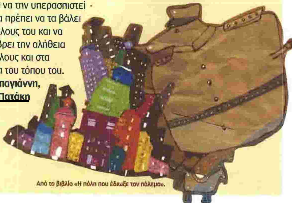
Από το βιβλίο «Η πόλη που έδιωξε τον πόλεμο».