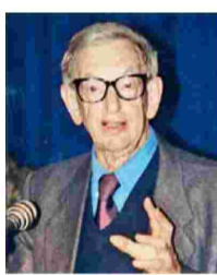
Ο Χορμισμπόουμ μάς υπενθυμίζει πόσο όμοιος είναι ο σημερινός παγκοσμιοποιημένος καπιταλιστικός κόσμος με τον καπιταλισμό που έβλεπαν ο Μαρξ και ο Εγγέλς, ήδη από το 1848.

Βέβαια, ο τίτλος του βιβλίου του Χορμισμπόουμ παραπέμπει στην 11η θέση του Μαρξ για τον Φόιερμπαχ: «Οι φιλόσοφοι δεν έκαναν τίποτε άλλο παρά να εξηγούν τον κόσμο με τον