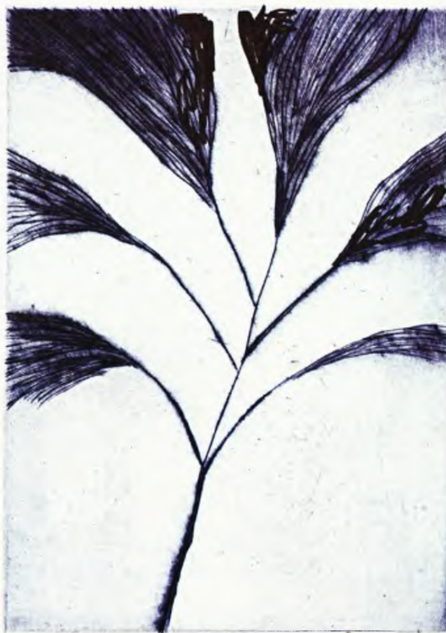
Λουίς Μπουρζούά, Άττιλο , 2004. MoMA.

Το βιβλίο του Άϊλενμπέργκερ είναι ένα συναρπαστικό άφήγημα. Διαβάζεται με όφελος αν περάσει κανείς πίσω από την κινηματογραφική φαντασμαγορία που ύψώνει ενάπιόν μας. ▲