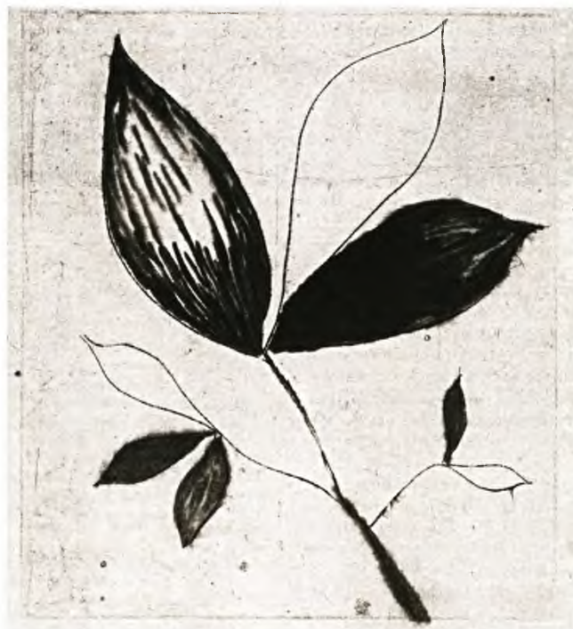
Λουίζ Μπουρζούα, Ἄντιλο , ἀπὸ τὴν σειρά Δέντρα , 2004. ΜοΜΑ.

Χρησιμοποιῶ τὸν ὄρο εἰκασία μὲ τὴν πλατωνικὴ του ἔννοια: μιὰ εἰκόνα μὲ αἰσθητικὲς ἢ διαισθητικὲς καταβολές, λιγότερο ἢ περισσότερο ἀμυδρὴ, χωρὶς ὅμως σταθερότητα, ἀφοῦ ἀμέσως προσβάλλεται, ὑπονομεύεται, ἐξαερούται ἀπὸ ἄλλες αἰθήσεις, διαισθήσεις ἢ ὁραματισμούς. Ἡ χρησιμοποιῶ-