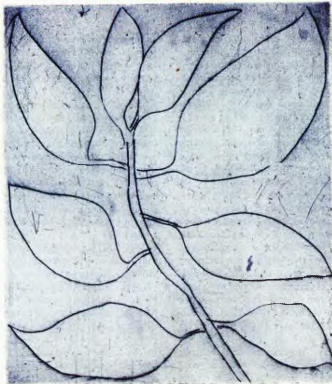
Λουίζ Μπουρζουά, Ἄγγιλο, ἀπὸ τὴν σειρά Δέντρα, 2004. MoMA.

Ἡ χριστιανικὴ περίοδος δὲν ἐνδιαφέρει, ὡς προελέχθη, τὸν Γκρέυλινγκ. Καταπιάνεται ὅμως λεπτομερῶς μέ τις ἀπαρχές τῆς νεώτερης σκέψης. Ἐδῶ προεξάρχει ἡ κλεινὴ βρετανικὴ τριάδα τῶν ἐμπειριστῶν (Λόκ, Μπέρκλεϋ, Χιούμ), μέ προπομπὸς τοὺς τὸν Μπαίηκον. Ἀπέναντί τοὺς ὑψώνεται ἀσφαλῶς ὁ Καρτέσιος, τὸν ὁποῖο ψαλιδίζει ὅμως δραστηρικὰ ὁ Γκρέυλινγκ γιὰ δύο λόγους. Πρῶτον, γιατί κατέβασε πάλι τὸν Θεὸ ἀπὸ τοὺς οὐρανοὺς (μέ τήν ἀναβίωση τοῦ ὄντολογικοῦ λεγομένου ἐπιχειρή-