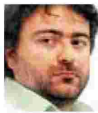
Γράφει ο Δημήτρης Ν. Μανιάτης

« Α γαπάμε όπως και όσο μπορούμε ως ατελή όντα που είμαστε». Με έναν παράδοξο τρόπο, η τελευταία φράση του δοκιμίου «Το παράδοξο του έρωτα» είναι το αποκρυστάλλωμα του Πασκάλ Μπρικνέρ και το κλειδί για να ερμηνεύσουμε τα νέα του συμπεράσματα από το προσφιλές του θέμα: τον έρωτα. Ο γάλλος συγγραφέας έχει τη δική του διαδρομή και τις δικές του εμμονές: είναι το τρομερό παιδί των Νέων Φιλοσόφων (ένα δυναμικό μα όχι ομοιόμορφο ρεύμα των τελών της δεκαετίας του '70). Είναι επίσης ο κάποτε μαθητής του Ρολάν Μπαρτ (θυμηθείτε τα «Αποσπάσματα του ερωτικού λόγου» του τελευταίου).