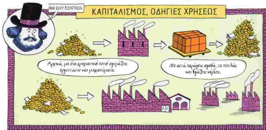
Ο Κάρολος Μαρξ ζωντανεύει και μιλάει, παρουσιάζοντας τη ζωή και το έργο του.

Γεννημένος στην Τριρ της τότε Πρωσίας το 1818, ο Κάρολος Μαρξ, σε πολλές στιγμές της