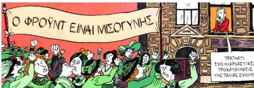
Φρόντ και φροϋδισμός σε ένα συγκινητικό πεδίο μάχης ενός νου που πάλεψε με τα ανθρώπινα αδιέξοδα.

Τα δύο βιβλία τους παρακολουθούν από την πρώτη σπίθα μέχρι τη φωτιά που άναψαν στην κατανόηση του κόσμου.