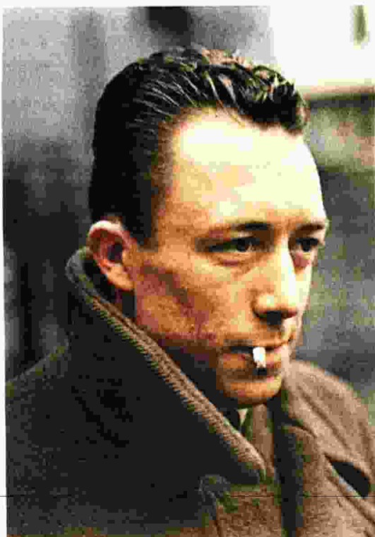
Επιχρωματισμένη φωτογραφία του γάλλου συγγραφέα και φιλοσόφου Αλμπέρ Καμί

«Αποφάσισα να εγκαταλείψω τη δημοσιογραφία, ή τουλάχιστον τη συστηματική ενασχόληση με τη δημοσιογραφία, επειδή ανέκαθεν ήθελα να αφιερωθώ στη λογοτεχνία. Πρακτικοί και καθαρά προσωπικοί λόγοι, δεν μου το επέτρεπαν μέχρι σήμερα, τώρα όμως τα πράγματα είναι διαφορετικά. Αλλιώς, σκέφτομαι πως βρισκόμαστε στο επίκεντρο μιας πολύ δύσκολης εποχής όπου η πνευματική διαύγεια δεν είναι πια ανεκτή, ούτε ιδιαίτερος περιζήτητος ως αρετή ή ως καθήκον, όπως δηλαδή θα έπρεπε: είμαστε αναγκασμένοι, από τη μια ή από την άλλη πλευρά, να αιτιολογούμε τις γνώμες και τις απόψεις μας και να υποθετούμε αυτές ακριβώς που αιτιολογούν, αδικώς, τον θάυμασμό ή την αποστροφή. Με