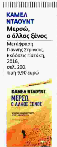
ΚΑΜΕΛ ΝΤΑΟΥΝΤ Μετάφραση Πάνης Στριγκός, Εκδόσεις Πατάκη, 2016, σελ. 200, τιμή 9,90 ευρώ

Ο αλγερινός συγγραφέας και δημοσιογράφος εξηγεί στο «Βήμα» γιατί ασχολήθηκε με το εμβληματικό έργο του νομπελίστα συγγραφέα, μιλάει για τη σημασία της ελευθερίας, την έξαρση του ισλαμικού εξτρεμισμού και ό,τι θεωρεί παρακμή του αραβικού κόσμου